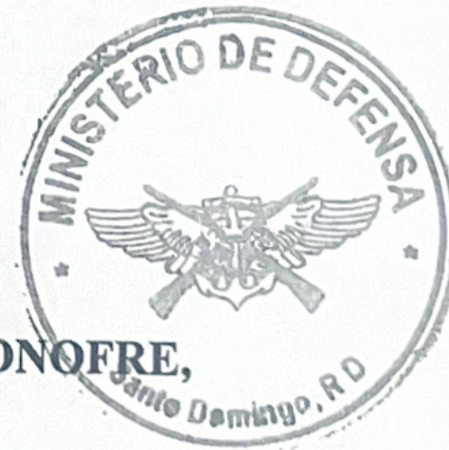
CARLOS ANTONIO FERNÁNDEZ ONOFRE, Teniente General, ERD. Ministro de Defensa.

Cortésmente, efectivo el día de la fecha, se le designa Comandante del Comando Conjunto Metropolitano de las Fuerzas Armadas, en sustitución del Mayor General FRANCISCO ANTONIO OVALLE PICHARDO, ERD. , a quien le serán asignadas nuevas funciones.