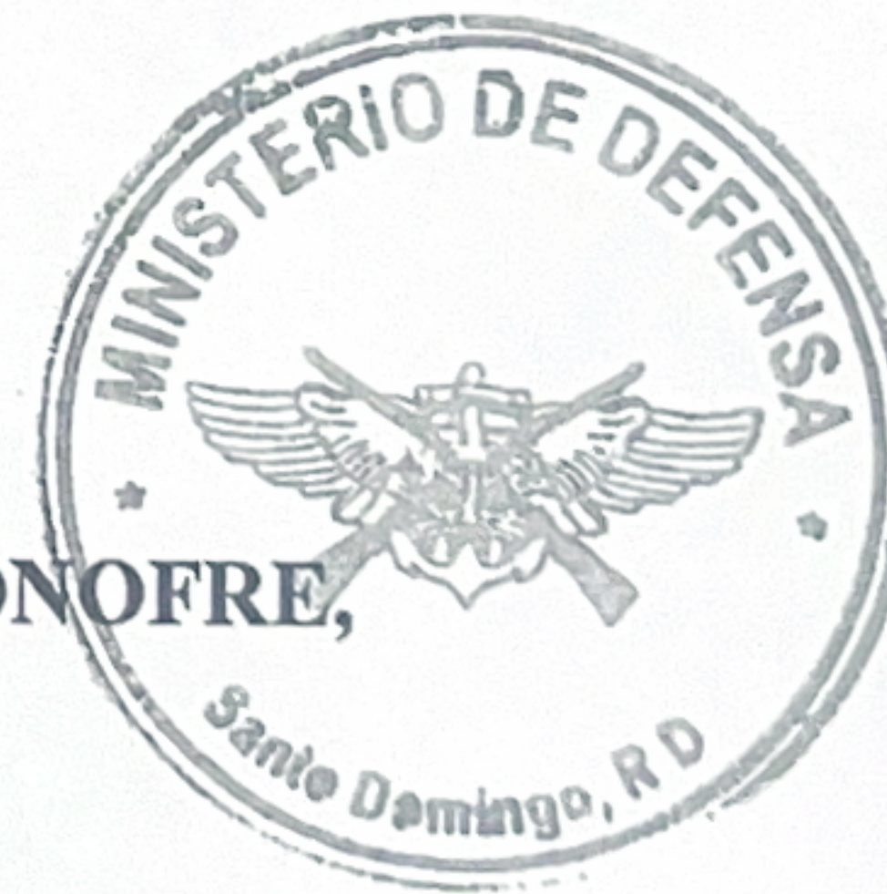
CARLOS ANTONIO FERNÁNDEZ ONOFRE, Teniente General, ERD. Ministro de Defensa.