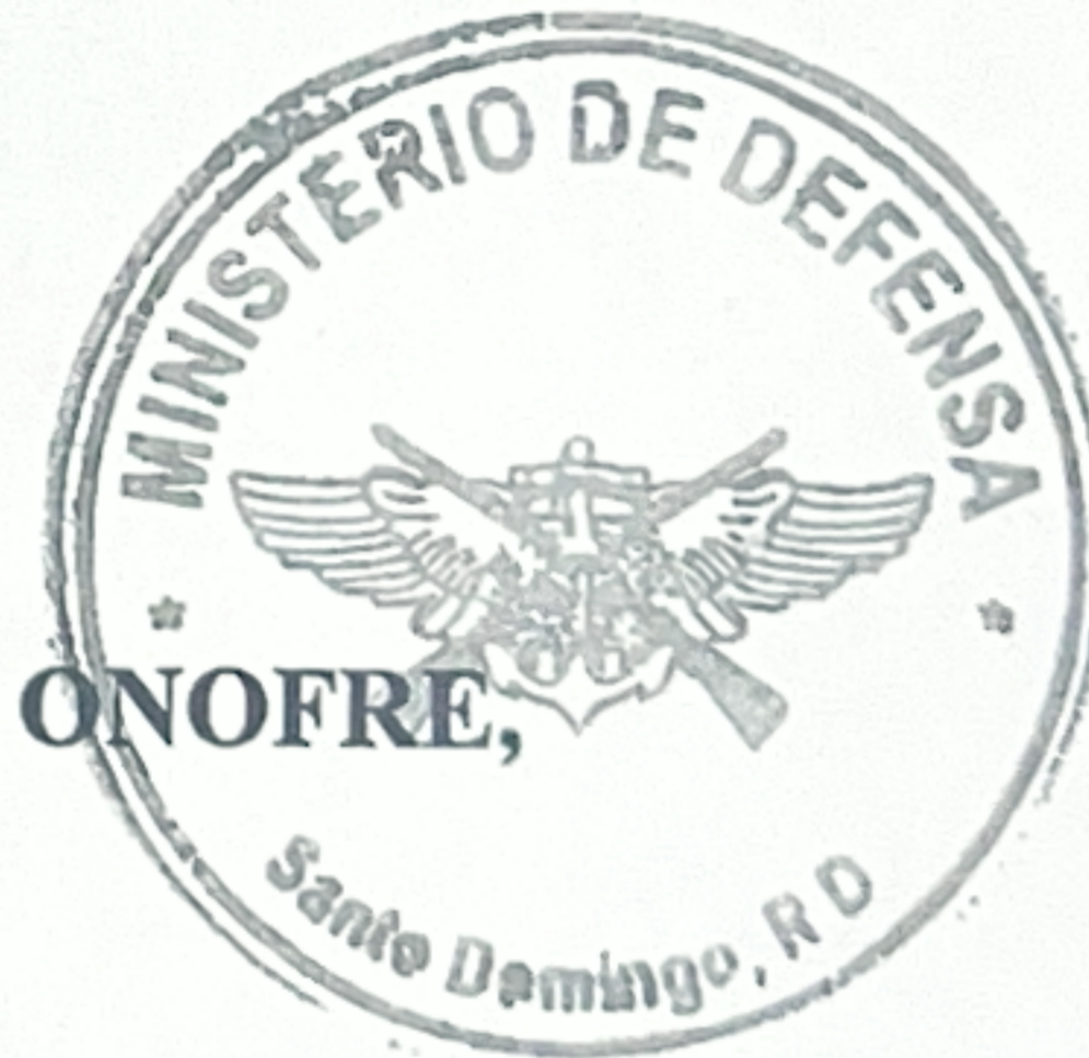
CARLOS ANTONIO FERNÁNDEZ ONOFRE, Teniente General, ERD. Ministro de Defensa.